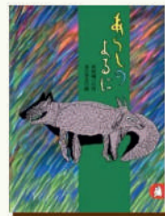
講談社 木村裕一作

朗読音声を耳で聴きながら本を黙読します。本の難易度にもよりますが、朗読音声は約15分ずつに区切っているので集中して読書ができます。